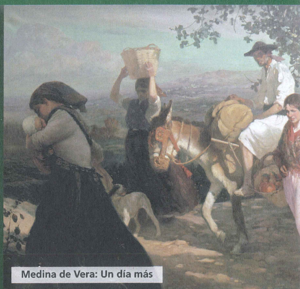
Medina de Vera: Un día más

Cuando España recuperó la democracia, Murcia se configuró como una Comunidad Autónoma uniprovincial: la Región de Murcia, con un Estatuto de Autonomía propio desde 1982.